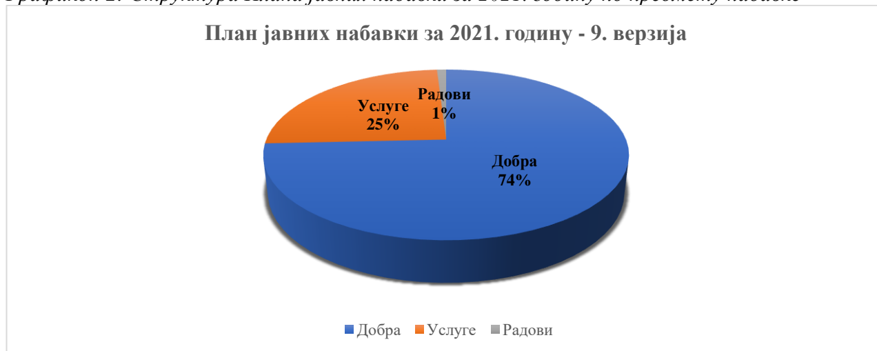
Графикон 2: Структура Плана јавних набавки за 2021. годину по предмету набавке

План јавних набавки Предузећа 2021. годину садржи све прописане елементе у складу са одредбом члана 88 став 1 важећег Закона о јавним набавкама.